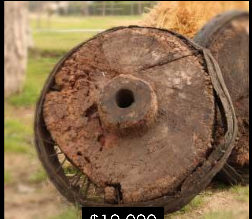
RUEDA DE MADERA