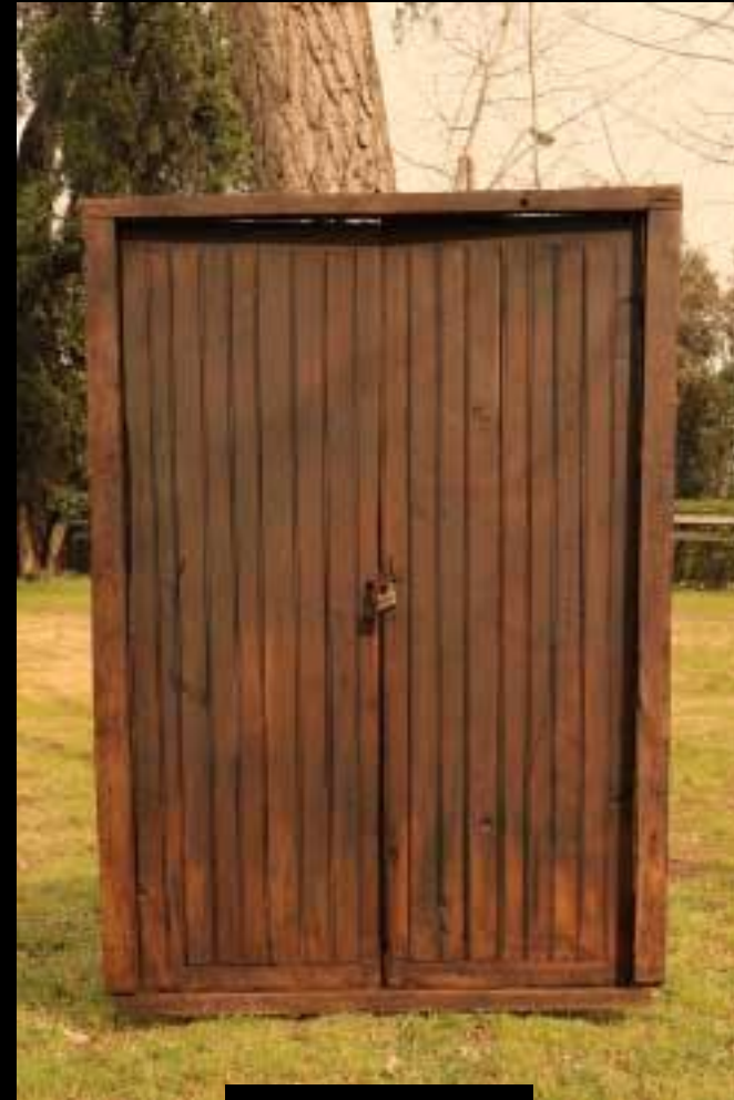
PUERTA DE CAMPO