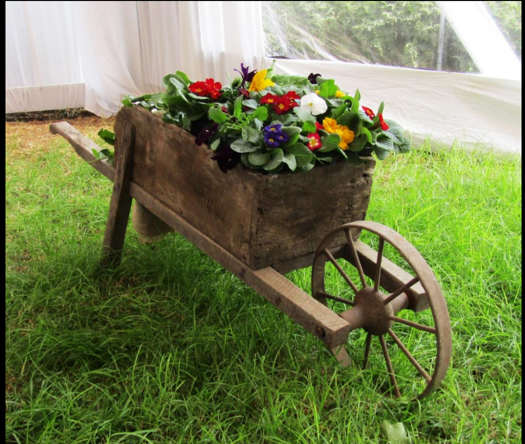
CARRETILLA CON FLORES