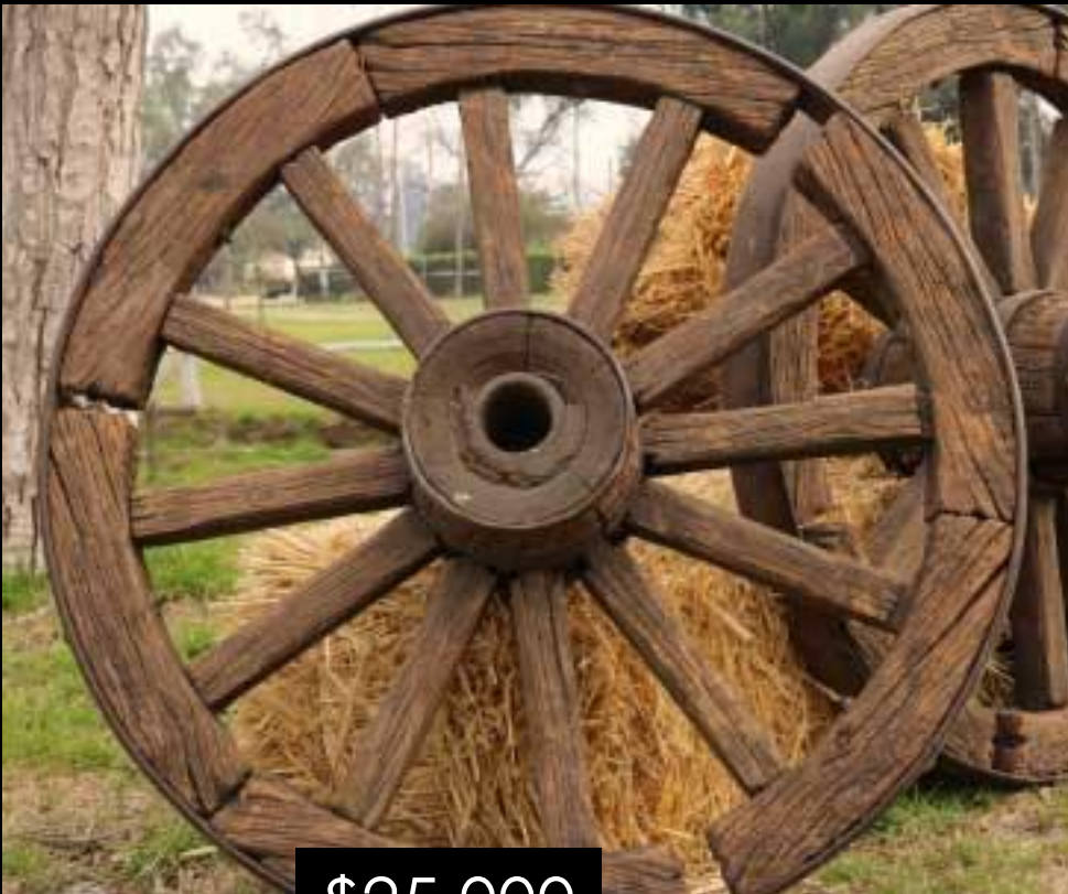
RUEDA DE RAYO