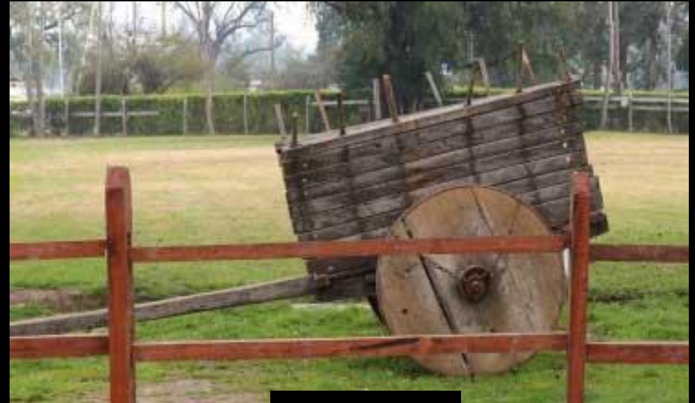
CARRETA ZONA CENTRAL