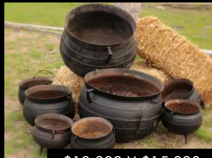
OLLETAS DE FIERRO