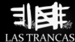
CERCO TRANQUERO ANTIGUO DE ROBLE