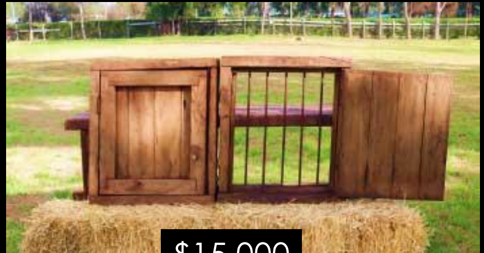
VENTANA DOBLE CON BARROTES