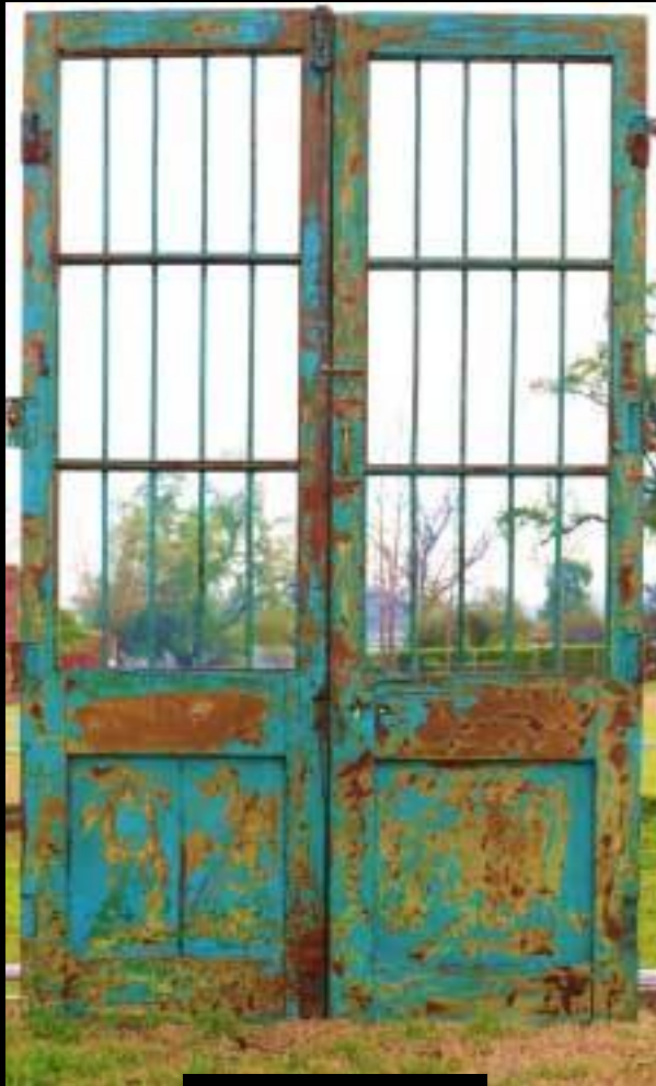
PUERTA BARROTE ANTIGUA