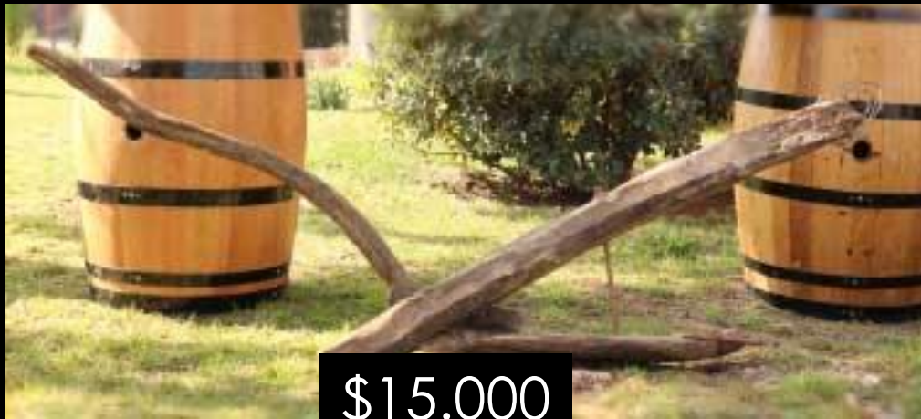
ARADO DE MADERA