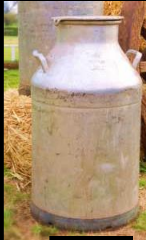
LECHERO 50 LTS