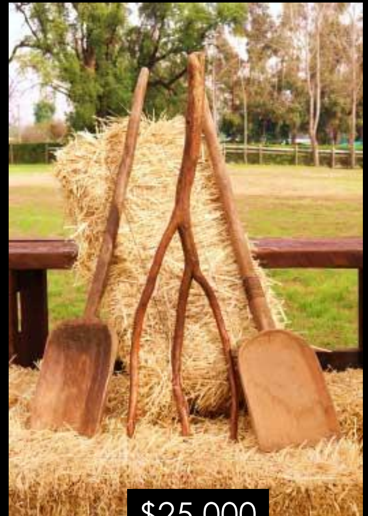
PALAS Y HORQUETA