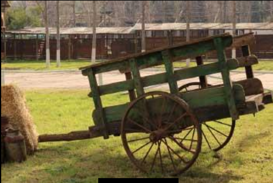
CARRETA RUEDA DE FIERRO